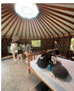
テントとログハウスに宿泊した。

楽しかったのは全校で実施した2泊3日のキャンプ(左写真)。皆で食事を作り、夜に肝試しをした。家で三姉妹と韓国ドラマを英語字幕で見たのも思い出だ。