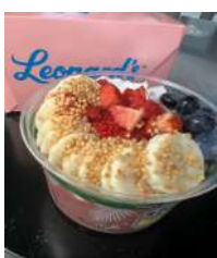
アサイーボールが3000円という物価高だった。