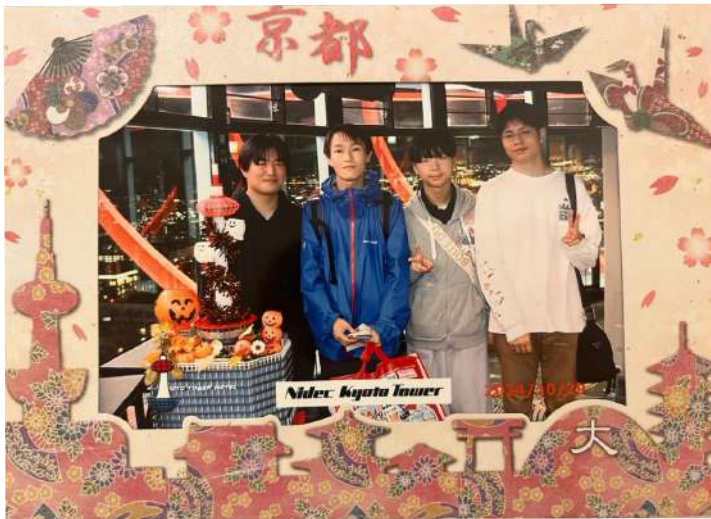
京都タワーで夜景をバックに記念写真。この後、京都駅で迷った。