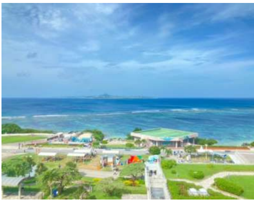
美ら海水族館からの眺め