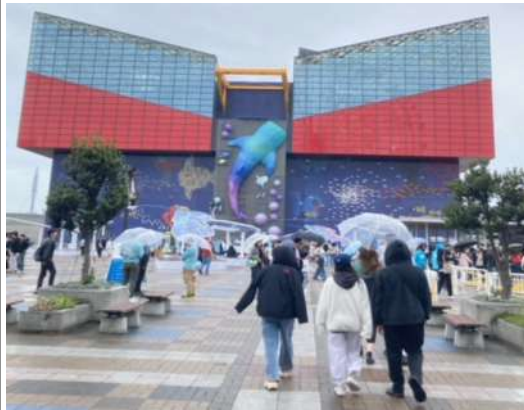
←大阪海遊館 日本の三大水族館の一つ、イルミネーションも見事だ。